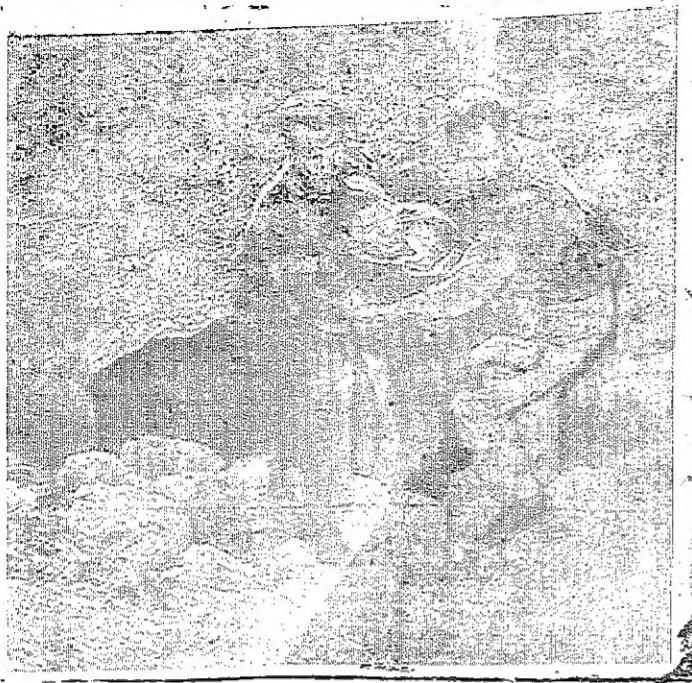
واحد من ضحايا العدوان الهمج يتقبل رجال الاتقاء من داخل المغارة التي لجأ اليها الاهالي

تصريحاً لرئيس تحرير في بيروت بيروت - وصل الى هنا صباح أمس دولة السيد بهجت التلهوني رئيس وزراء الاردن في زيارة رسمية للندن تستغرق يومين وكان الدكتور عبد الله الهادي رئيس وزراء لبنان في استقباله في المطار على رأس عدد من المسؤولين اللبنانيين وقام السيد التلهوني بعد وصوله اليقبة على الصفحة السادسة عمود ٤